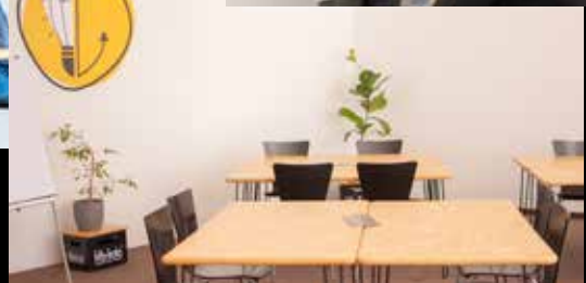
Tische & Stühle so stellen, wie ihr sie braucht